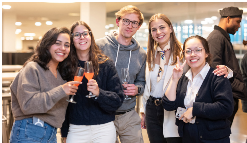
Innovation Sprint, sessão de apresentação de projetos, Nova SBE.